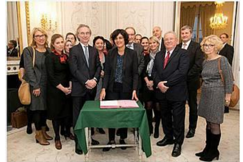
Signature de l'accord-cadre national le 15 novembre 2016 par Myriam El Khomri, ministre en charge de l'emploi, et les huit branches de la filière Textiles-Mode-Cuirs.

Un accord-cadre national portant Engagement de Développement de l'Emploi et des Compétences (EDEC) a été conclu pour la période 2016-2019, entre le Ministère du travail représenté par la Délégation générale à l'Emploi et la Formation (DGEFP) et les huit branches de la filière Textiles–Mode–Cuirs : Textile, Couture, Habillement, Services textiles, Pressing & Blanchisserie, Tannerie–Mégisserie, Chaussure, Maroquinerie. Cet accord a pour objet d'engager, préparer et accompagner les TPE-PME de la filière dans leur transformation numérique.