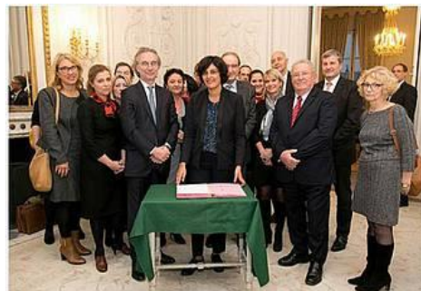
Signature de l'accord-cadre national le 15 novembre 2016 par Myriam El Khomri, ministre en charge de l'emploi, et les huit branches de la filière Textiles-Mode-Cuirs.

Un accord-cadre national portant Engagement de Développement de l'Emploi et des Compétences (EDEC) a été conclu pour la période 2016-2019, entre le Ministère du travail représenté par la Délégation générale à l'Emploi et la Formation (DGEFP) et les huit branches de la filière Textiles–Mode–Cuirs : Textile, Couture, Habillement, Services textiles, Pressing & Blanchisserie, Tannerie–Mégisserie, Chaussure, Maroquinerie. Cet accord a pour objet d'engager, préparer et accompagner les TPE-PME de la filière dans leur transformation numérique.